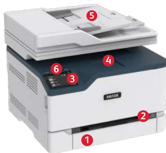
Impressora multifuncional a cores Xerox® C235