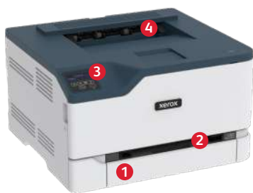
Impressora a cores Xerox® C230