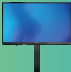
Altura ajustável parede