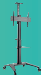
Altura ajustável suporte móvel