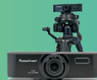
Kit Aula Híbrida O equipamento de referência da Promethean para a aprendizagem remota ou híbrida