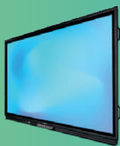
Altura fixa parede (incluído na compra)