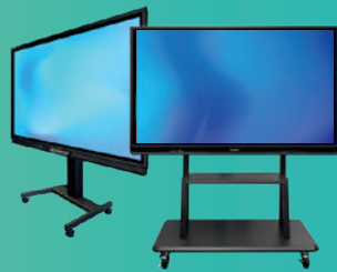
Altura fixa/ajustável suportes móveis