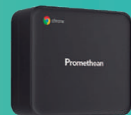
Promethean Chromebox A solução ideal para integrar num ecossistema de aplicações Google