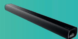
ActivSoundBar Obtenha um som perfeito em toda a sala. Com bluetooth integrado.