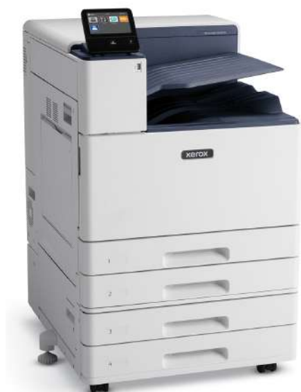
VersaLink® C8000W mais Módulo de Duas Bandejas